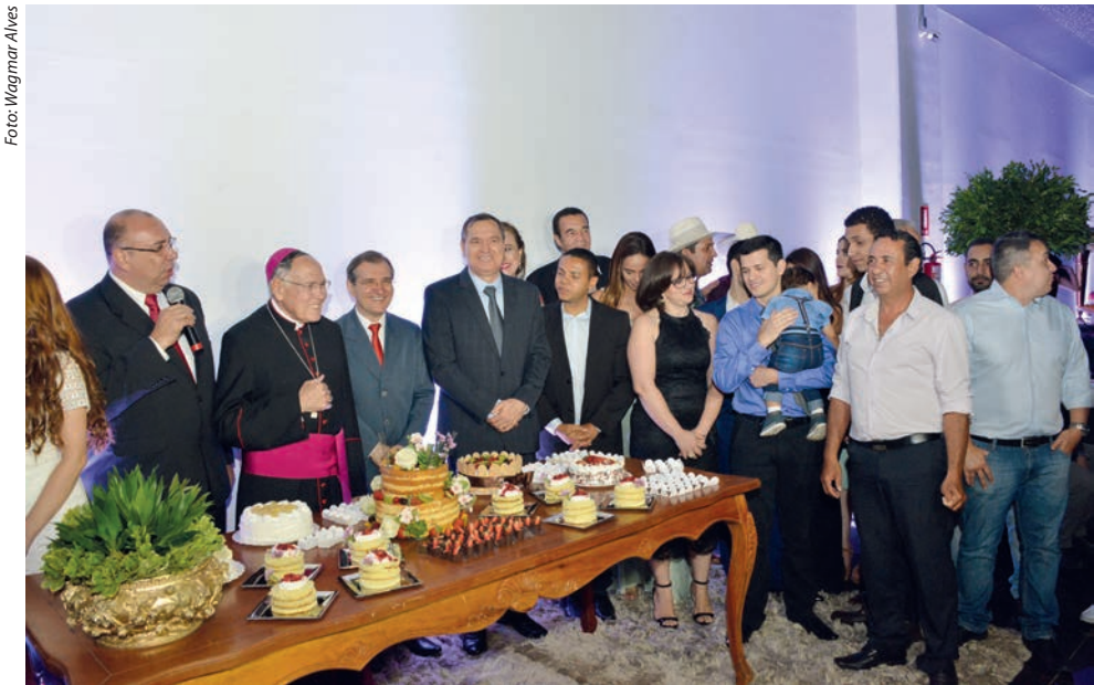
O aniversário de 10 anos da PUC TV (canal 24 UHF e 22 NET) foi um dos destaques da programação