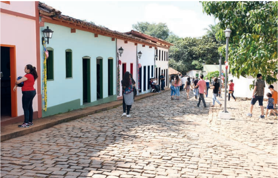
No Câmpus II da PUC, além de escolas acadêmicas, estão o Centro de Convenções de Goiânia e o Memorial do Cerrado