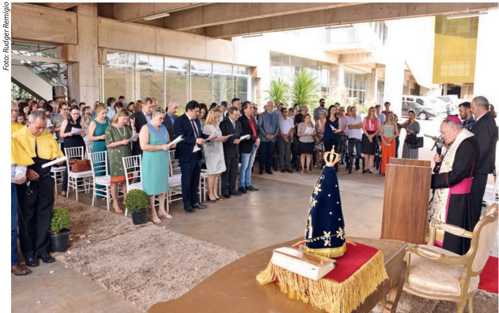
No dia do aniversário da PUC Goiás, Dom Washington Cruz presidiu a celebração de dedicação da capela construída no Câmpus II da PUC, quando foi entronizada uma Imagem Peregrina de Nossa Senhora Aparecida. A imagem foi enviada à Arquidiocese de Goiânia pelo Santuário Nacional de Aparecida (SP), visitou todas as paróquias e agora permanecerá naquela capela