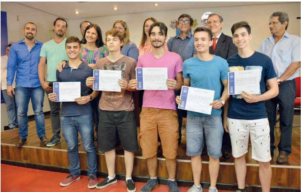
3º Congresso de Ciência e Tecnologia da PUC registrou mais de 3 mil pesquisas apresentadas e quase 13 mil participantes. Integraram sua programação o 9º Encontro dos Estudantes da Extensão e o lançamento de 19 livros da Editora PUC. Na foto, grupo premiado na Olimpíada de Cálculo