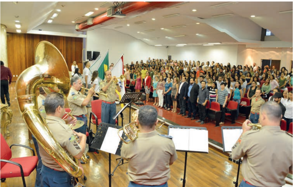
Enfermagem foi um dos cursos reunidos para a criação da Universidade de Goiás, que comemorou 75 anos